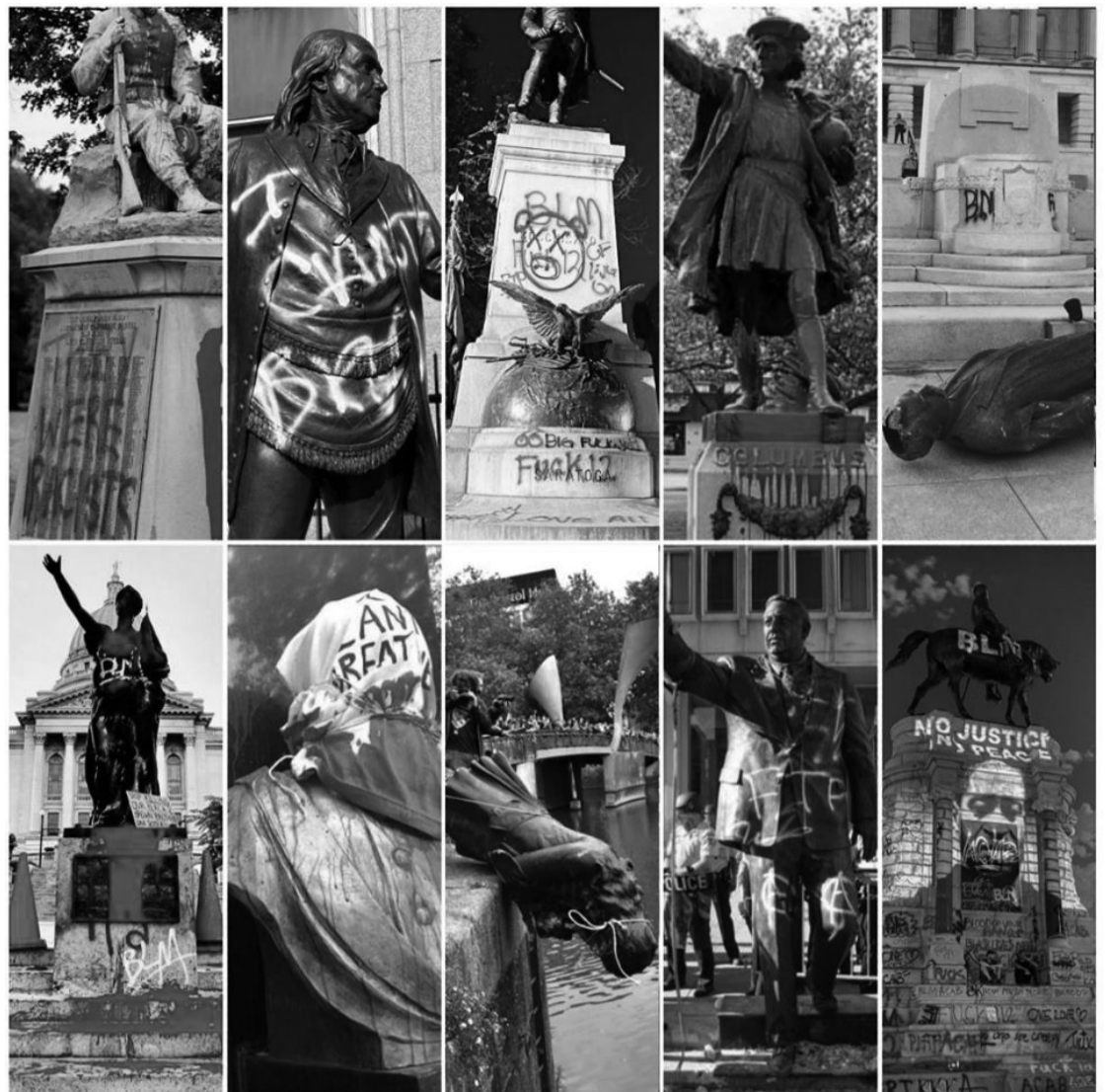
Πάνω: Βανδαλισμένα και κατεστραμμένα μνημεία δουλεμπόρων και ρατσιστών πολιτικών στις Η.Π.Α.