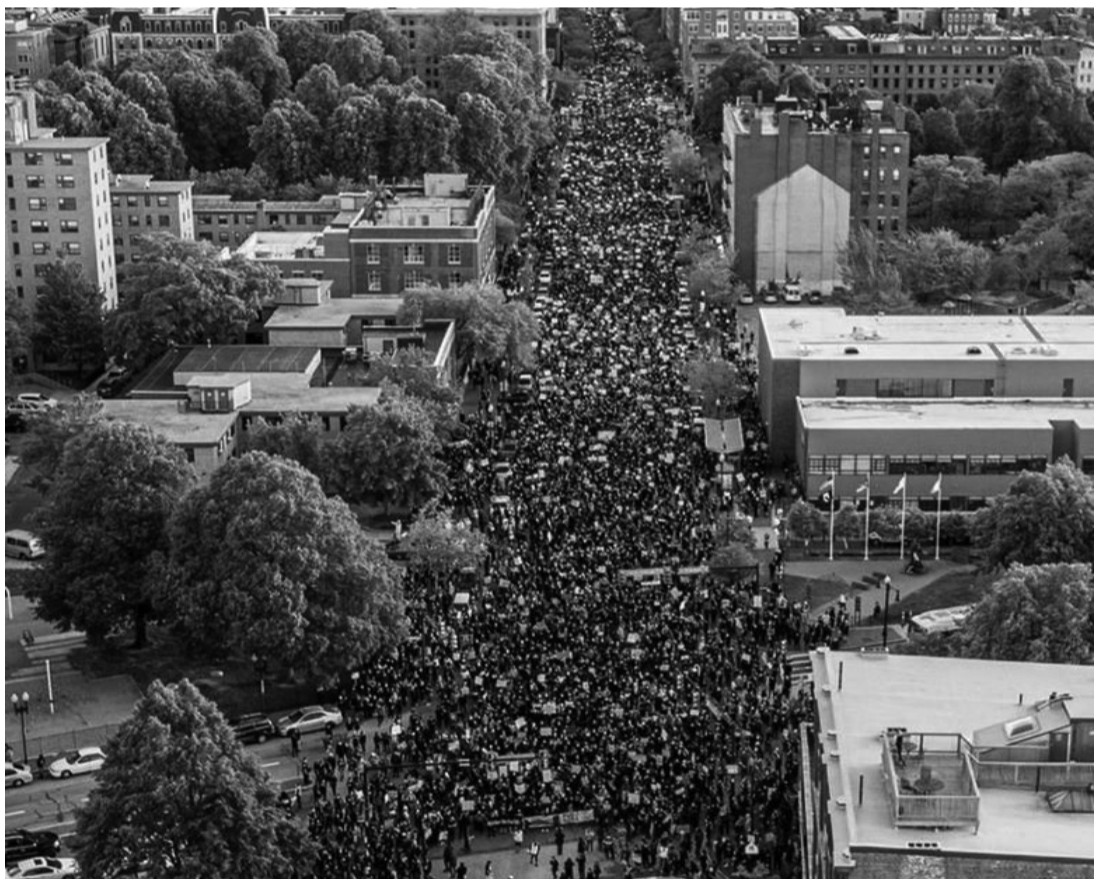
Πάνω: Μαζική διαδήλωση κατά του ρατσισμού και της αστυνομικής βίας στη Βοστώνη. Διαδηλώσεις με εκατοντάδες χιλιάδες ανθρώπους έλαβαν χώρα σε δεκάδες πόλεις των Η.Π.Α.

και να καίνε κτίρια. Οι νέοι λοιπόν ανταποκρίνονται σε αυτό. Εξαγριώνονται. Και υπάρχει ένας εύκολος τρόπος για να το σταματήσετε. Συλλάβετε τους μπάτσους. Αποδώστε τους κατηγορίες. Αποδώστε κατηγορίες σε όλους τους μπάτσους, όχι μόνο σε λίγους και όχι μόνο εδώ στη Μινεάπολις. Συλλάβετε τους σε κάθε πόλη της Αμερικής όπου τα αδέρφια μας δολοφονούνται. Αποδώστε τους κατηγορίες παντού. Αυτό είναι το συμπέρασμα. Κάντε τη δουλειά σας. Κάντε αυτό που υποτίθεται ότι πρεσβεύει αυτή η χώρα. Η χώρα της ελευθερίας για όλους. Δεν υπάρχει ελευθερία για τους μαύρους και έχουμε κουραστεί. Μην μας μιλάτε για πλιάτσικο. Εσείς κάνετε πλιάτσικο. Η Αμερική καταλήστευσε τους μαύρους. Η Αμερική καταλήστευσε τους αυτόχθονες στην αποικιοκρατία. Οπότε το πλιάτσικο είναι δική σας πρακτική. Από εσάς τη μάθαμε. Όπως από εσάς μάθαμε και τη βία. Οπότε αν θέλετε από εμάς να γίνουμε καλύτεροι τότε πρέπει πρώτα να γίνετε εσείς.